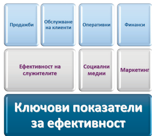
Фиг. 1. Типове ключови показатели за ефективност.

се предлагат във всевъзможни комбинации и тяхното многообразие произтича от различните цели и потребности, както на самата организация, така и на безкрайните потребности и търсения на клиентите, които организацията се опитва да удовлетвори. Ключовите показатели за ефективност се отличават и по своята сложност и размери, тъй като всеки от тях служи за наблюдаване на конкретна и специфична цел при оценката на различните аспекти от дейността на организацията (фиг. 1).